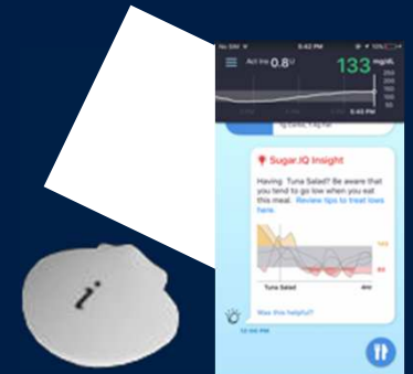
CGM in Standard Use

Para que se obtenga todo el valor de estas nuevas terapias, debemos aportar Valor en Sanidad (no sólo resultados clínicos)