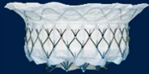
Transcatheter Mitral Valves