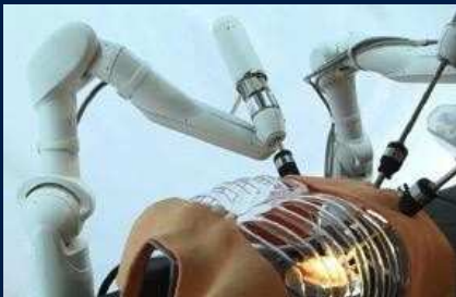
Advanced Surgical Tools and Robotics